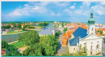
Blick auf die Stadt und die Basilika